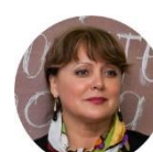
Светлова Валентина Ильинична заслуженная артистка РФ, лауреат Государственной премии России