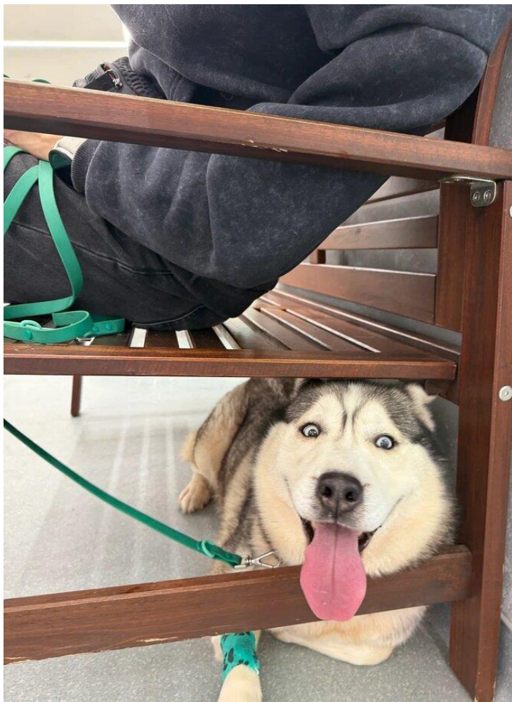
На фото: Вьюга – подопечная приюта Save Husky – восстановилась после успешного удаления опухоли и ждёт контрольного осмотра в клинике.