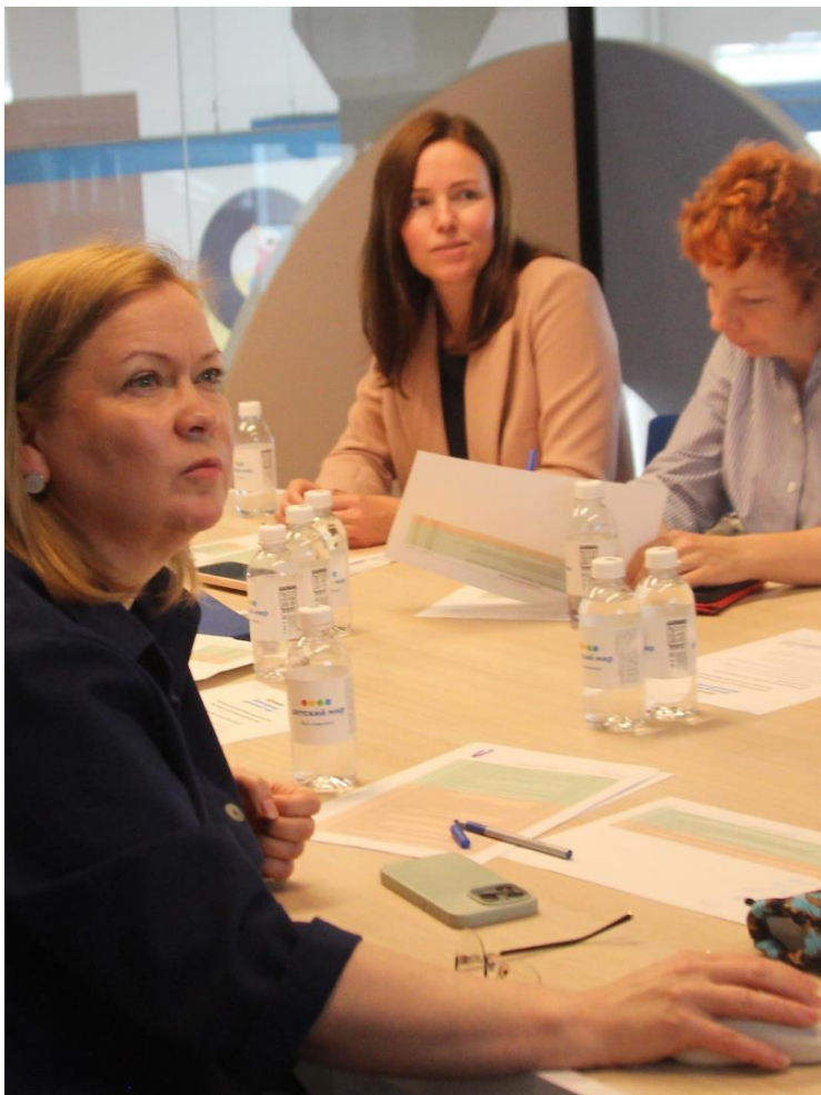
На фото: Заседание коллегиальной комиссии экспертов грантового конкурса 2025г.

В 2025 году Фонд объявил грантовый конкурс на развитие программ подготовки приёмных родителей, адаптации и сопровождения детей в замещающих семьях.