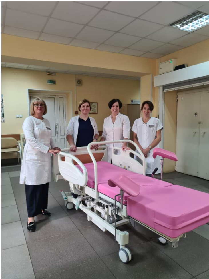
На фото: сотрудники Родильного дома №1 с новой функциональной кроватью