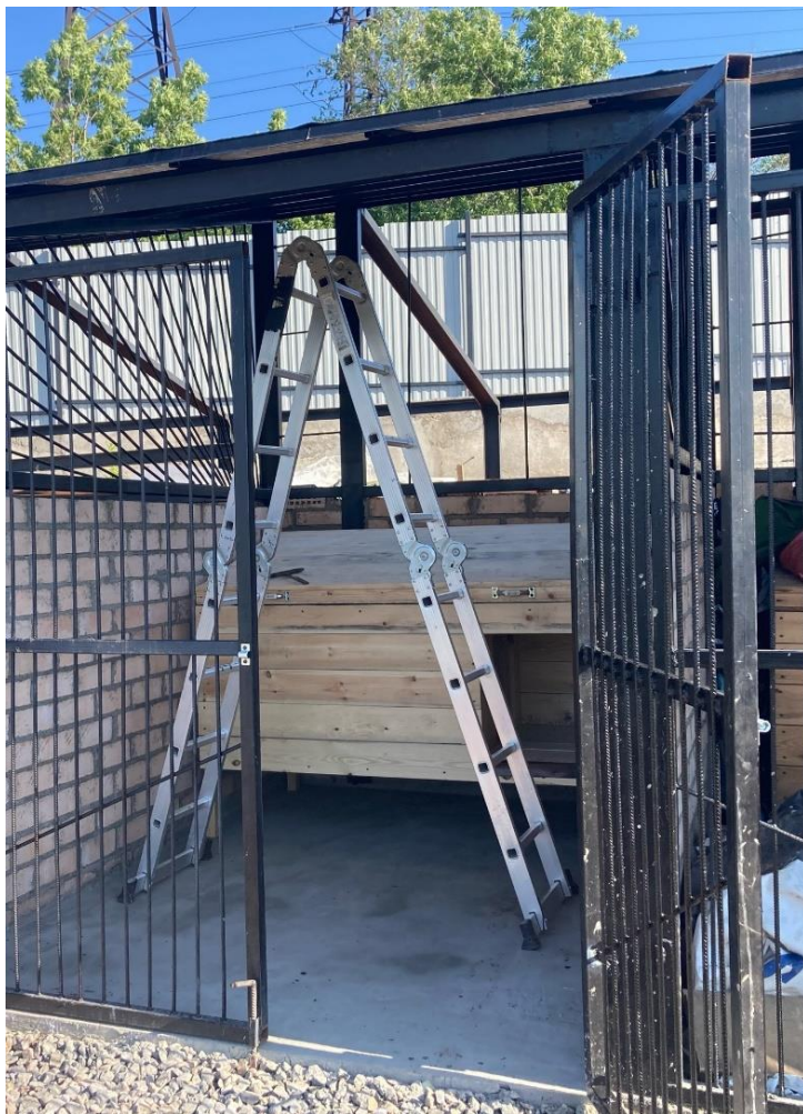
На фото: один из вольеров с новой крышей