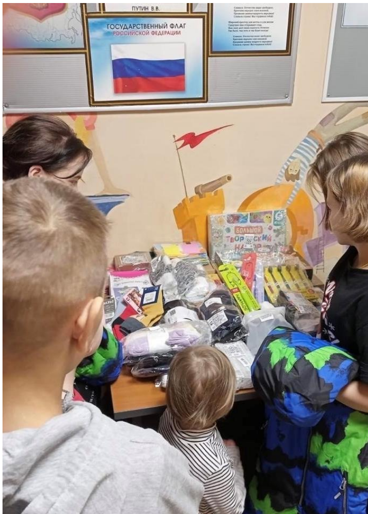
На фото: передача вещей для «Соколов фонд»