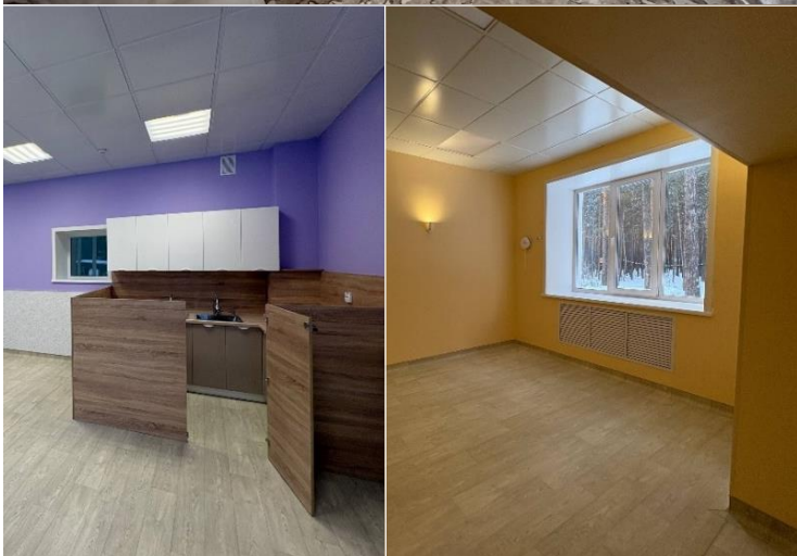
На фото: спальни и игровая-столовая после проведённого ремонта, обновления электропроводки, вентиляции, светильников.