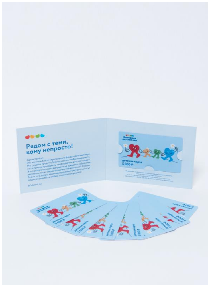
На фото: подарочный сертификат проекта «Детская карта» номиналом 5000 рублей в фирменной обложке.

В рамках проекта Фонд выпускает специальную линейку сертификатов номиналом 5 000 рублей, на которые можно приобрести детские товары в розничной сети «Детский мир» и интернет-магазине detmir.ru. Бюджет проекта формируется из частных пожертвований в ящики в магазинах «Детский мир» и через виджет в интернет-магазине detmir.ru.