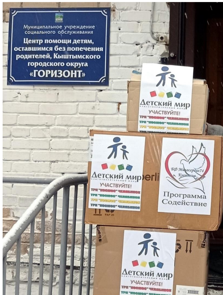
На фото: переданные товары для подопечных благотворительного фонда «Милосердие», г. Кыштым