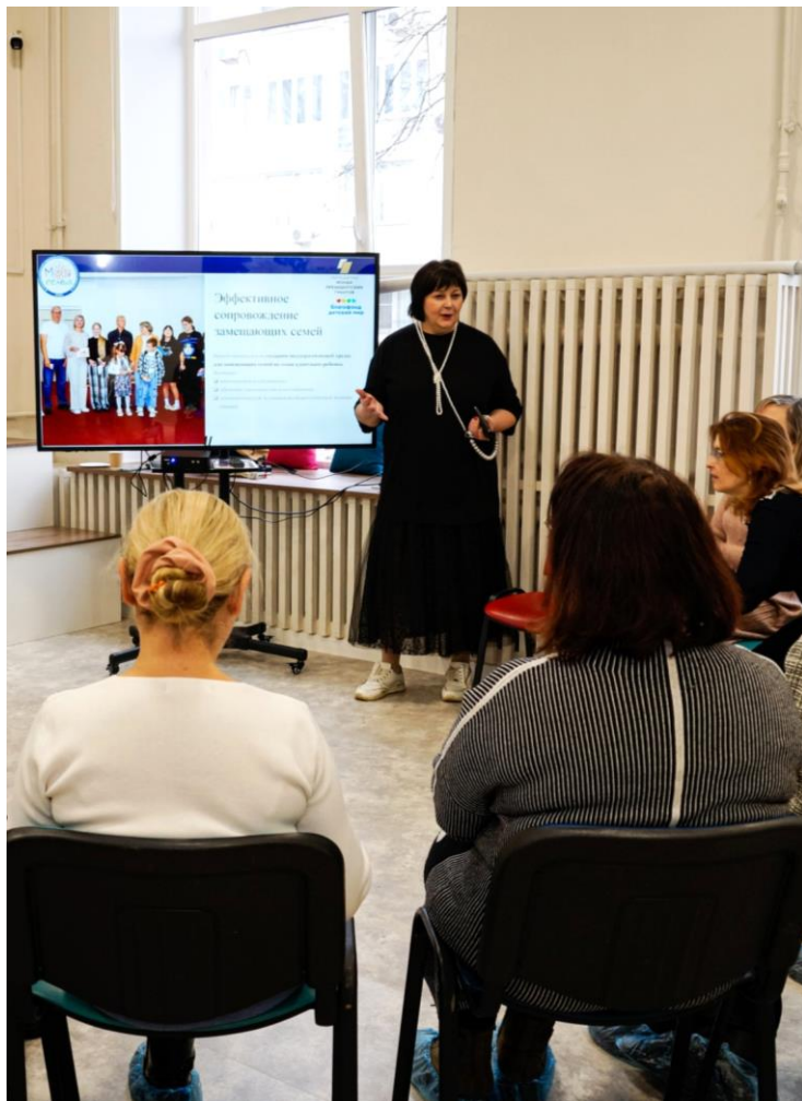
На фото: занятие для сотрудников органов опеки Ярославской области в АНО «Моя семья», получившей грант в рамках Конкурса.

В 2024 году Фонд объявил грантовый конкурс на поддержку проектов сопровождения замещающих семей.