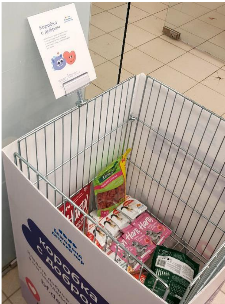
На фото: корзина для товаров в рамках программы «Уют в приют» в магазине Зоозавр