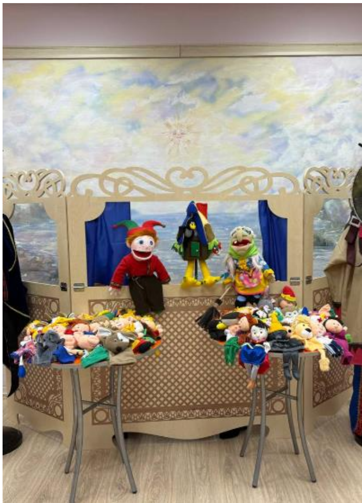
На фото: оборудованный кукольный театр в Центре социальной реабилитации инвалидов и детей-инвалидов Невского района Санкт-Петербурга