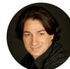
Кюрдзидис Эвклид Кириакович актер театра и кино, заслуженный артист РФ