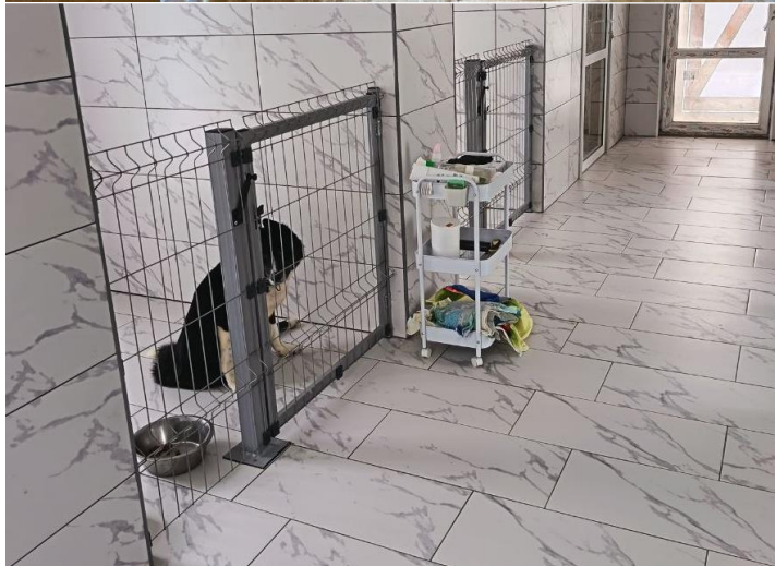
На фото: сверху – помещение до ремонта, снизу - обустроенный теплый бокс в приюте «Беригиня»