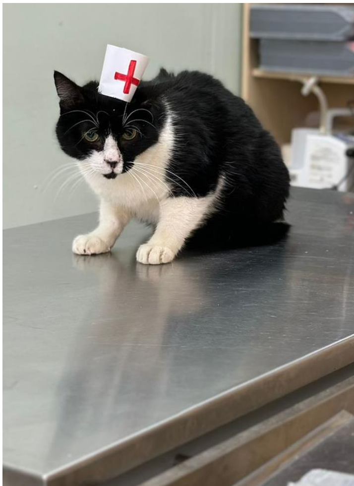
На фото: кошка – подопечная приюта на новом ветеринарном столе